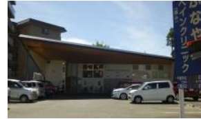
ふなやまペインクリ