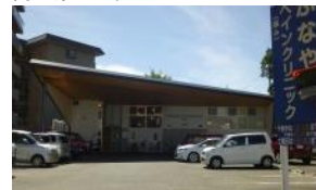
ふなやまペインクリ